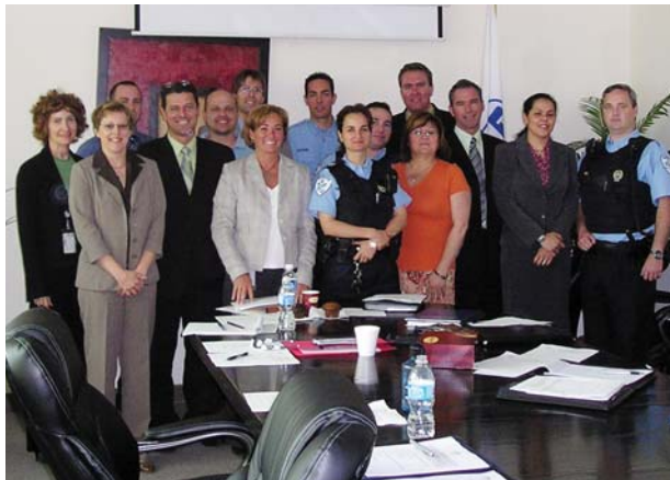
« Les membres du Comité de qualité de vie de la région Est et les responsables des sous-comités espèrent que vous vous impliquerez en répondant en grand nombre au sondage qu'ils vous soumettront. »

Avant de recommander des améliorations, ils devront d'abord évaluer la situation actuelle grâce à un sondage conçu par la Section du programme d'accès à l'égalité et de la qualité de vie au travail, qui a d'ailleurs déjà servi de base aux travaux réalisés dans la région Ouest, en collaboration avec plusieurs unités du Service. Ce sondage aborde différents thèmes; ainsi, par ce sondage, tout le personnel de la région Est aura l'occasion de s'exprimer sur la valorisation, sur la reconnaissance