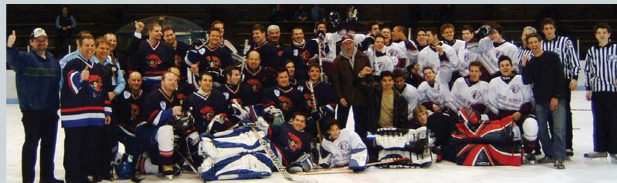
Les deux équipes, en compagnie de leurs entraîneurs et des officiels : tout s'est déroulé dans les règles.

policiers qui s'y sont intéressés et impliqués. Tous ont semblé apprécier l'expérience au point de la renouveler l'an prochain. Et les jeunes n'ont qu'à bien se tenir car nos joueurs ont l'intention de bien s'entraîner d'ici là !