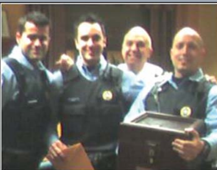
Photo prise par téléphone cellulaire