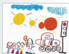
Thaly Chancy, 2 e année