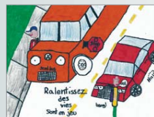
Mathieu Gagné-Pelosse, 5 e année