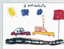
Karel Benoit, 1 re année