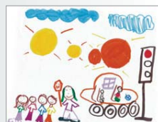
Thaly Chancy, 2 e année