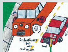
Mathieu Gagné-Pelosse, 5 e année