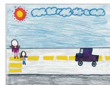
Kenza Achoutal, 3 e année