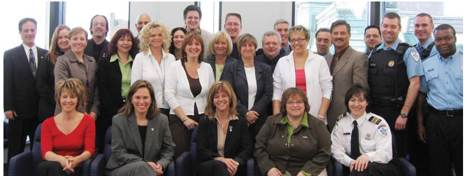
Constater le grand nombre de personnes impliquées, c'est réaliser un peu la complexité de l'exercice.

L'unification des centres de communication permet d'améliorer le service et de réduire le temps de réponse alors que l'exploitation de deux centres de communication en parallèle garantit la continuité des opérations.