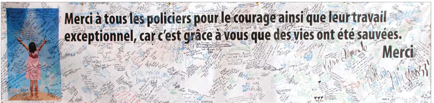
Cette bannière a été offerte par les étudiants du Collège Dawson au SPVM.