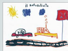
Karel Benoit, 1 re année