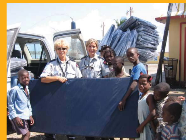
... et pour la réception des matelas. Ils ont maintenant la chance d'avoir chacun un lit, muni d'un matelas. Luxe supplémentaire: la collecte ayant dépassé les espoirs, on a même pu leur offrir des draps.