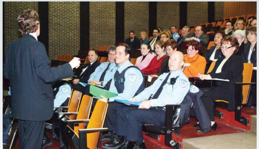
Le 26 janvier dernier, plus de soixante directeurs de la CSEM ainsi que des commandants, sergents-détectives et agents sociocommunitaires des postes de quartier 40, 42, 45, 46, 47 et 49 et des membres de la SIJP de la région Est ont participé à la journée organisée dans les locaux de Lester B. Pearson High School.

Ces deux activités d'information s'ajoutent à celle que cette section a réalisée avec la Commission scolaire de la Pointe-de-l'Île en 2005. Une fois de plus, elles témoignent du souci de maintenir un partenariat étroit avec les principaux acteurs du milieu scolaire pour mieux circonscrire les problématiques reliées aux jeunes, rechercher et identifier des solutions afin de régler les situations préoccupantes.