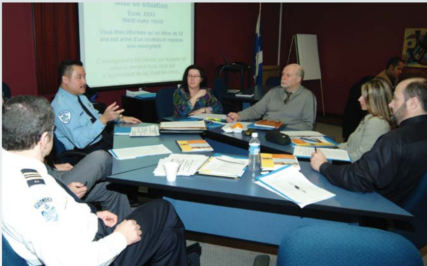
Les directeurs de la CSDM, le commandant du Poste de quartier 46, le sergent-détective et l'agent de concertation de la SIJP de la région Est ont travaillé en sous-groupe à l'aide d'une mise en situation.