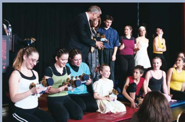
Spontanéité et talents étaient au rendez-vous lors des prestations des artistes de l'école de cirque de Verdun