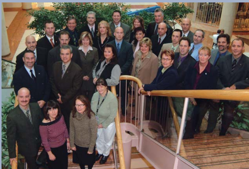
Section des agressions sexuelles CATÉGORIE ENGAGEMENT ET ACTION PROLONGÉE – ÉQUIPE