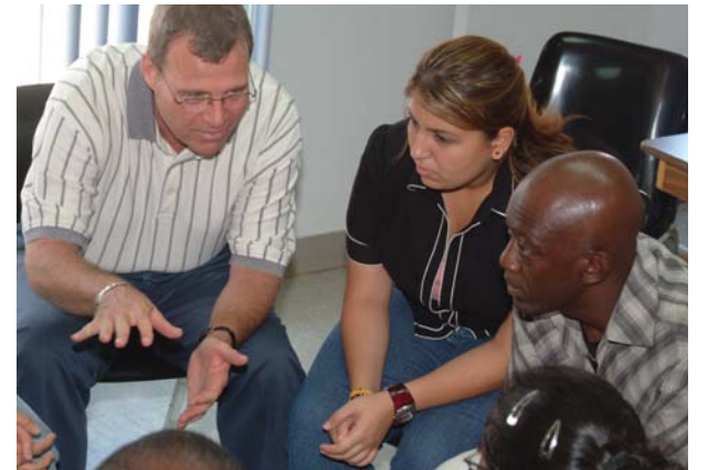
Une équipe très concentrée sur sa préparation

Une vidéo cassette sur la formation et les joutes d'improvisation sera disponible au cours du mois de décembre prochain. Pour obtenir de plus amples renseignements, vous pouvez contacter M. Minh Lê au (514) 280-4160.