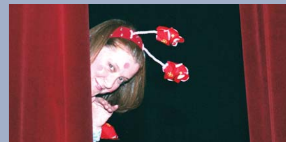
« Pour moi, le Gala s'inscrit comme un moyen de soutien parmi des milliers d'autres possibles en matière de valorisation de nos employés. Et s'il y a une campagne qui doit être en vigueur toute l'année, c'est bien celle de la valorisation, celle de la propagation du sourire. »