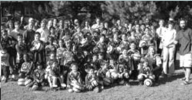
Que de participants ravis!

Lancé le 22 juin dernier par les policiers du poste de quartier 30 et des membres de l'arrondissement de Villeray-St-Michel-Parc-Extension le projet de soccer « Vision vers l'avenir » a permis d'offrir à 40 enfants de 6 à 11 ans et à 30 jeunes de 12 à 15 ans la chance de développer leurs habiletés sportives, leur esprit d'équipe et leur sens des responsabilités, d'apprendre la discipline et de créer des liens avec le Service de police de la Ville de Montréal et les intervenants du milieu.