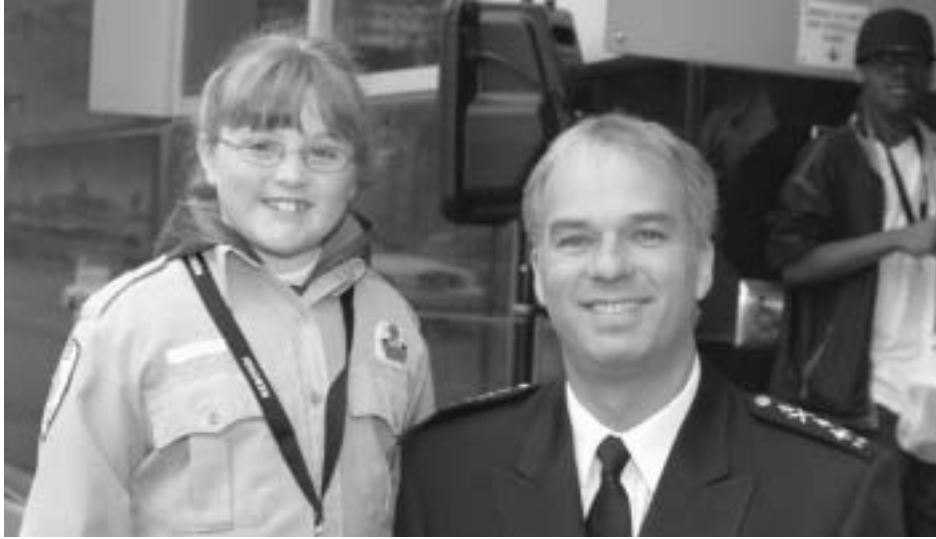
Les fiançailles avaient quasi été annoncées...

Enfin, dans l'arène Desjardins, des policiers de l'équipe de soccer ont défendu leur titre de champions face à des dizaines d'enfants qui n'avaient qu'une idée en tête; les écraser à plate couture. Parlant de Rebondi, le projet entre dans sa phase 3. La maison des Jeunes L'Escale 13-17 devient un partenaire important du programme. En effet, pour le projet Rebondi, l'Escale assurera la coordination du projet dans la communauté et favorisera le lien entre les 21 PDQ et les jeunes. L'Escale est fiduciaire de la subvention de Patrimoine canadien et celle-ci servira à payer le salaire de la personne engagée à la coordination ainsi qu'aux frais associés.