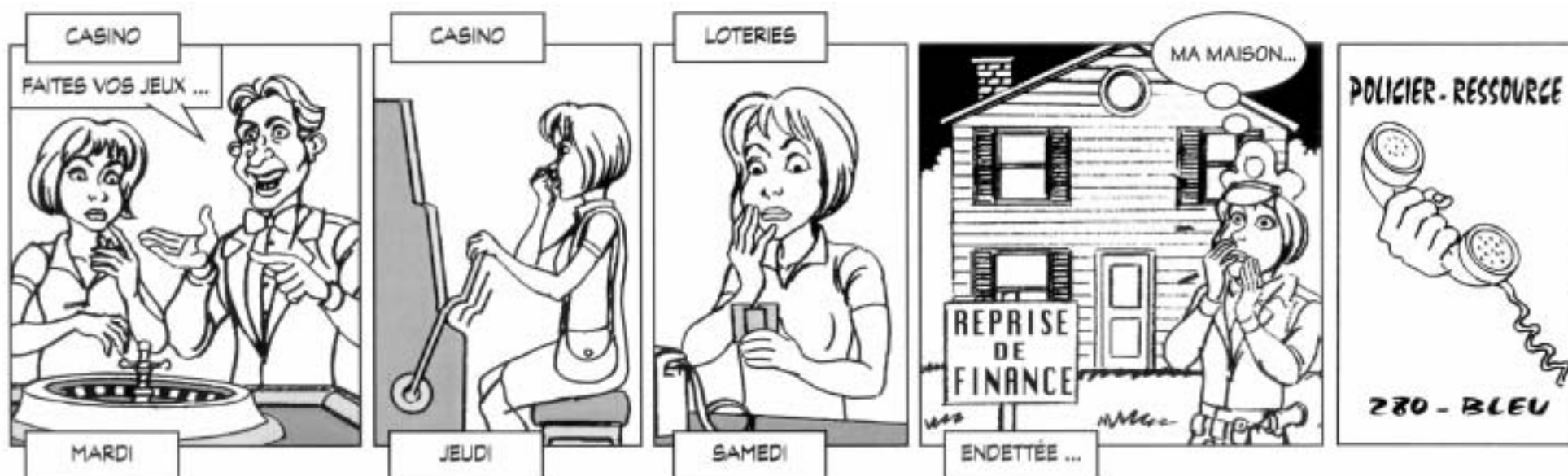
Le scénario de cette bande dessinée est fictif et sans égard au sexe du personnage. Il vise à donner un exemple de situation pour laquelle un policier ou une policière recourrait au programme Policier-Ressource.

N'hésitez pas, communiquez avec le 280-BLEU si un jour tu en as besoin. Lorsque l'on s'exprime et que l'on verbalise nos émotions, c'est souvent là que l'on trouve nous-mêmes les meilleures solutions !